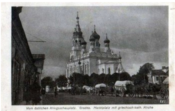
Vom dälischen Kriingschauplatz. ©Grodno. Marktplatz mit griechisch-kath. Kirche

130 гадоў таму (1883) – У в. Лакцяны (Астравецкі р-н) нарадзіўся Янка Быліна (сапр. Ян Семашкевіч), беларускі каталіцкі сьвятар, пісьменьнік, паэт.